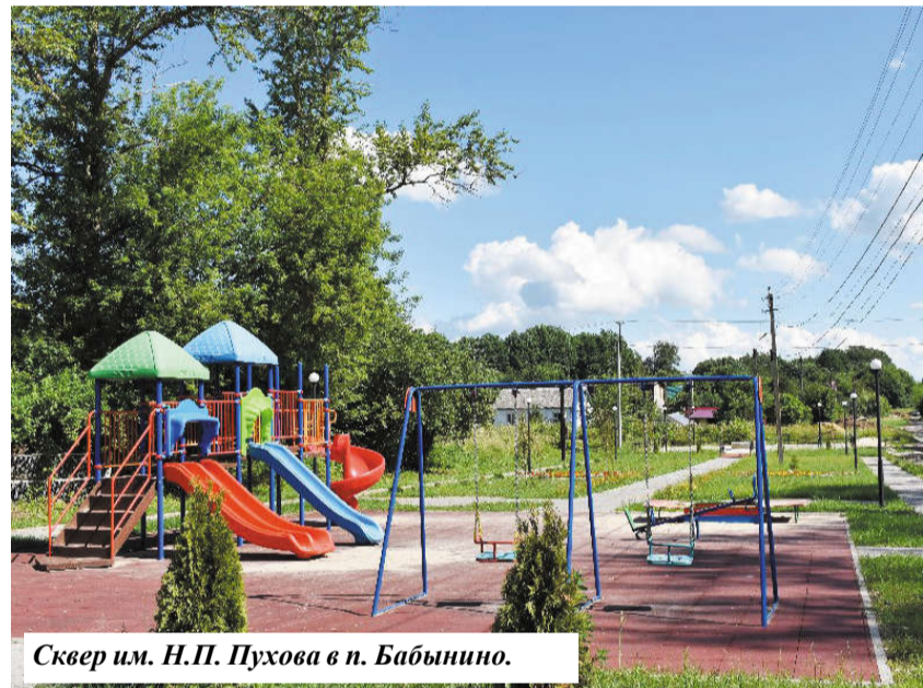
Сквер им. Н.П. Пухова в п. Бабынино.

Социально-ориентированный бюджет района в большей степени направлен на содержание и укрепление материально-технической базы школ и детских садов. Только в этом году на эти мероприятия из бюджета района направлено 9 млн. руб. А это и установка пожарных сигнализаций в МКОУ «СОШ №1» с. Бабынино, МКОУ «СОШ №1» п. Воротынский, МКДОУ «ДС