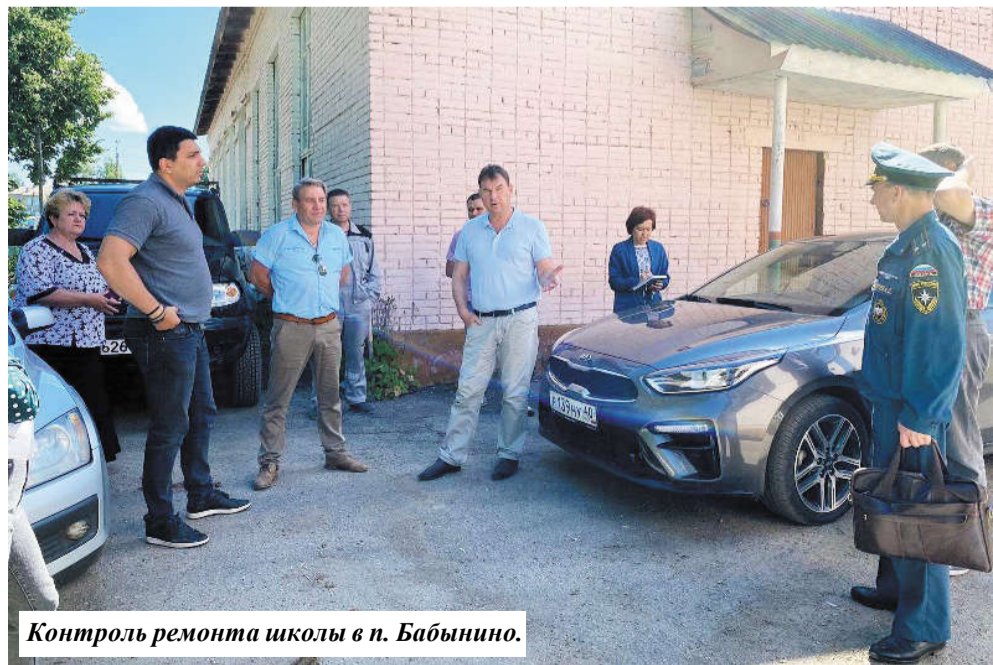
Контроль ремонта школы в п. Бабынино.

«Алые паруса» п. Воротынский, и установка ограждения и ремонт помещений в МКОУ «СОШ №2 им. И.С. Унковского» п. Воротынский, и замена оконных блоков и дверных групп в столовой и ремонт крыльца в МКОУ «ООШ» с. Вязовна, и ремонт помещений и лестничных пролетов в МДОУ «ДС «Улыбка» п. Бабынино. В рамках программы «Модернизация школьных систем образования» ведется капитальный ремонт начальной школы МОУ «СОШ №2» п. Бабынино (87 млн. руб.) и разрабатывается проектно-сметная документация на капитальный ремонт школ в п. Газопровод и с. Муромцево. В рам-