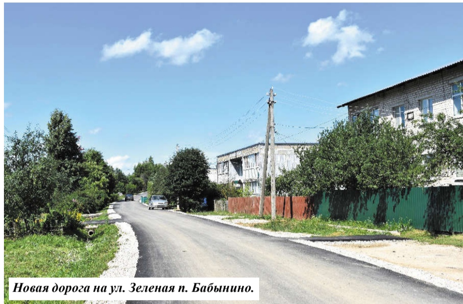
Новая дорога на ул. Зеленая п. Бабынино.

В рамках Национального проекта «Здравоохранение» в этом году производится капитальный ремонт здания женской консультации в п. Бабынино и здания поликлиники п.