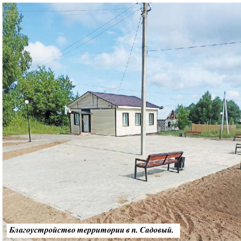
Благоустройство территории в п. Садовый.

В рамках Национального проекта «Жилье и городская среда» «Формирование комфортной городской среды» благоустраиваются 2 дворовые территории: в п. Воротынский ул. Сиреневый бульвар д. 2, 4 и д. 8, 10, 12 и 2 общественные территории: в Бабынино – детская площадка в центральном парке и в Воротынке по адресу ул. Сиреневый бульвар д. 2, 4 и д. 8, 10, 12.